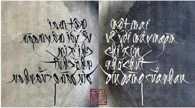
Thư pháp NGỌC DUNG.

Những điều không muốn nhớ cứ vẫy búa một đời kiếp sau làm giống hổ trong rừng mà chạy chơi.