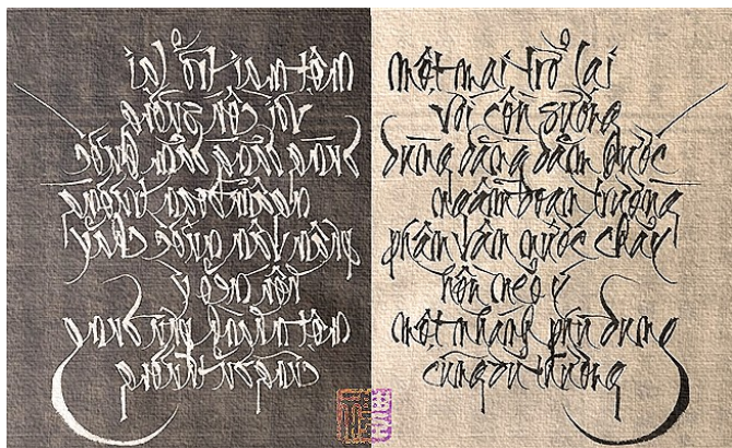
Thư pháp NGỌC DUNG.

Đến hạn tôi về trong mây thôn trống chiêng không gọi đã khua dồn đếm đi đếm lại chừng năm tháng điểm tóc tro phai mặt mạc hồn.