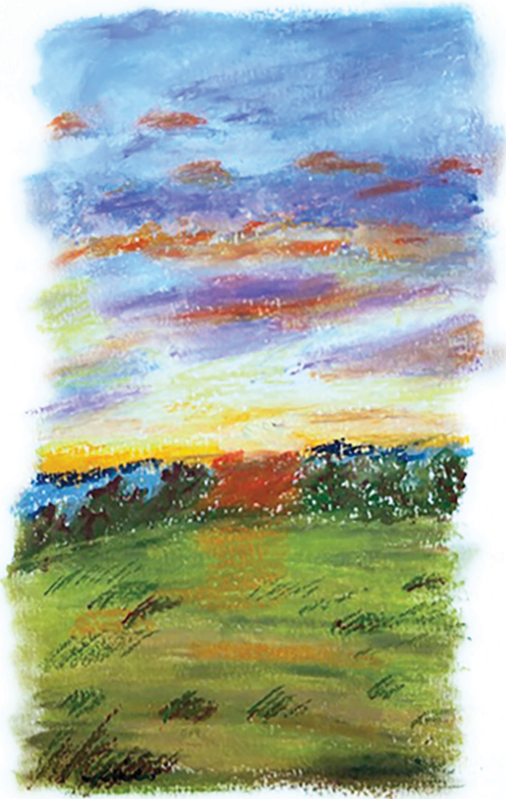
Tranh: Phibi Duong