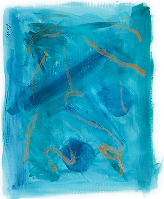
Tranh: Phibi Duong