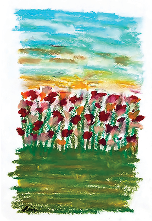
Tranh: Phibi Duong