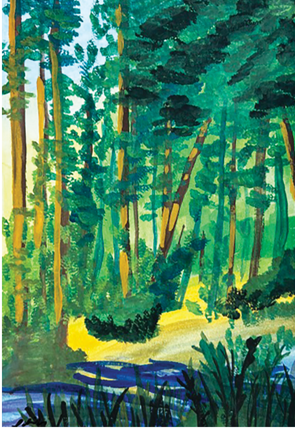
Tranh: Phibi Duong