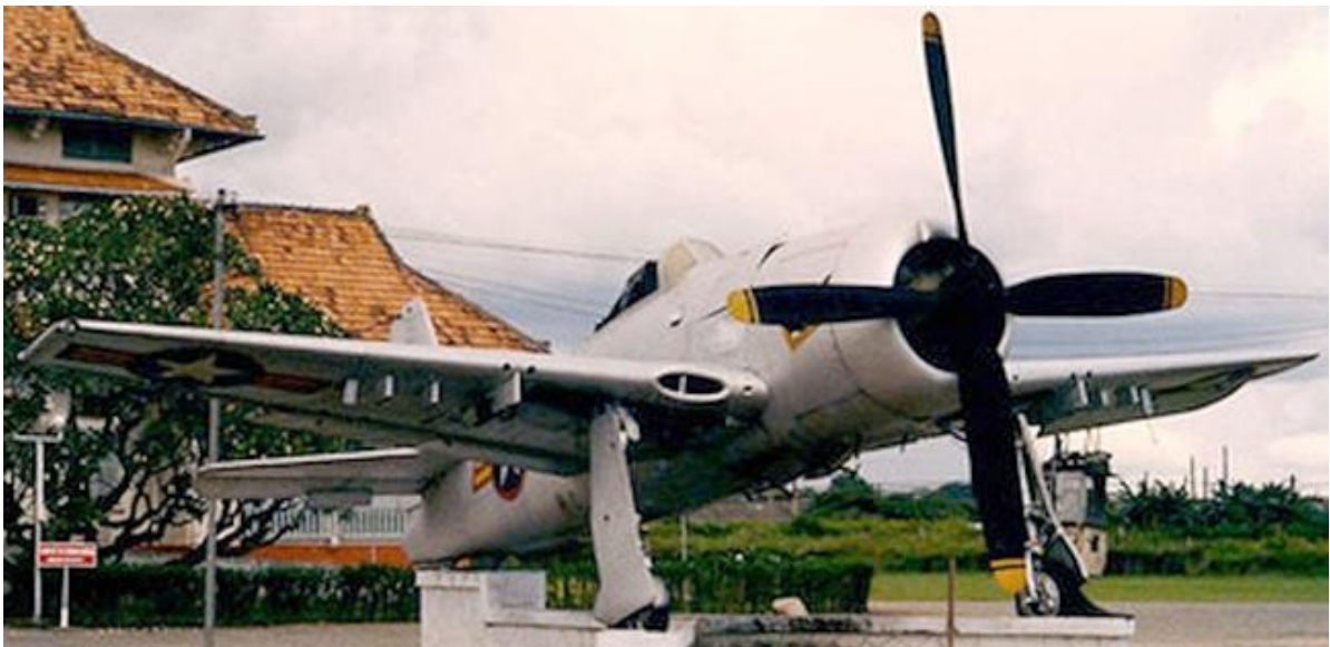
CLB Huỳnh Hữu Bạc