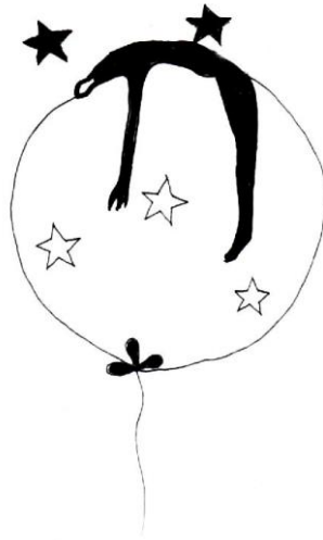
minh họa của Lê Ký Thương

Đến ngàn năm sau nữa, người ta mới tìm thấy xác của hắn còng queo, thu nhỏ bằng viên sỏi, xạm đen, tiệp trên mỏm đá đen và được phủ lên chiếc khăn choàng trắng, mái tóc rối tung thơm mùi sữa, ôm ấp hắn trong những cơn gió thốc tháo thổi đến.